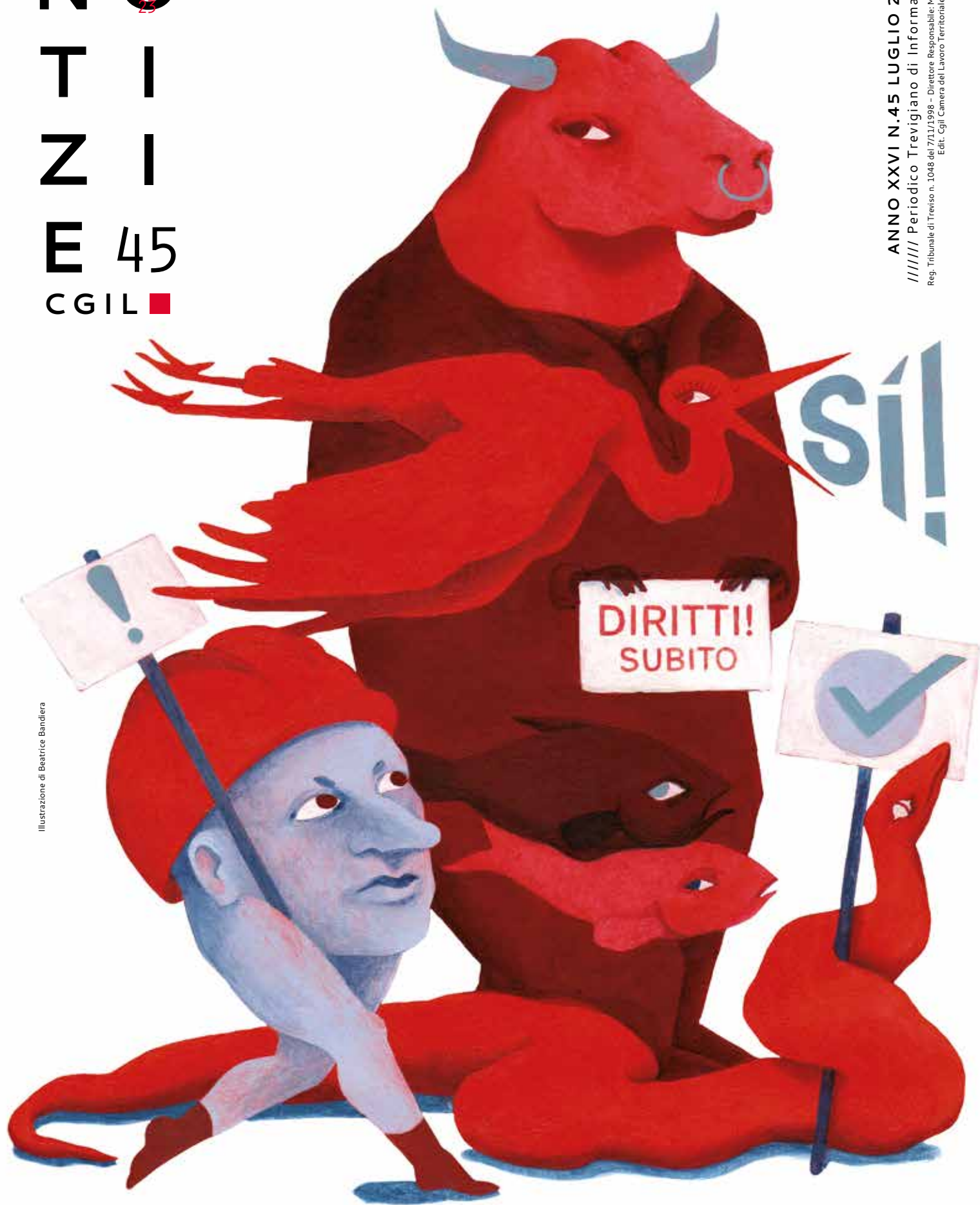
Illustrazione di Beatrice Bandiera

ANNO XXVI N.45 LUGLIO 2023 Periodico Trevigiano di Informazione Reg. Tribunale di Treviso n. 1048 del 7/11/1998 - Direttore Responsabile: Marina Milan Edit: Cgil Camera del Lavoro Territoriale di Treviso